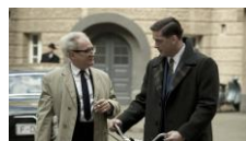
29.3.16: Der Staat gegen Fritz Bauer