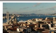
26.7.16: Hasret - Sehnsucht