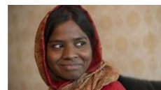
28.6.16: Dämonen und Wunder - Dheepan